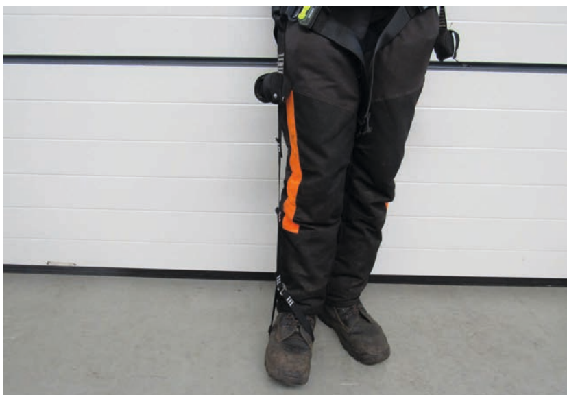
Entlastung durch Stemmen eines Fußes in eine Trittschlinge

Untersuchungen haben gezeigt, dass Auffangsysteme den effektivsten Schutz vor Abstürzen bieten. Diese Systeme ermöglichen es den Arbeitern, in gefährlichen Positionen zu arbeiten, indem sie im Falle eines Sturzes aufgefangen werden und die Fallstrecke sowie die Fangstoßkraft begrenzen. Bei einem Absturz halten die