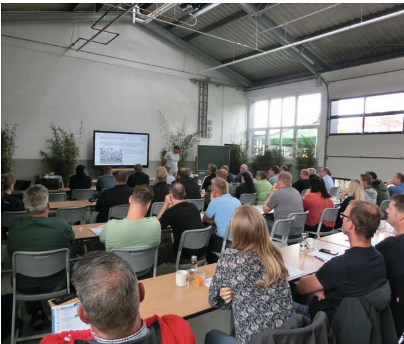
Der Oldenburg-Ostfriesische Wasserverband informiert zum Thema »Wasserverfügbarkeit – wo bleibt unser Wasser?«

Auch für Mitarbeiter kommunaler Bauhöfe bieten die DEULA-Bildungszentren zahlreiche interessante Weiterbildungsangebote an. Sie können sich bei der DEULA in Ihrer Nähe informieren. Darüber hinaus können Sie sich online unter www.deula.de informieren.