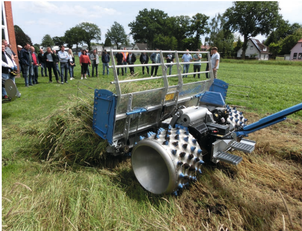
Einsatz vom Brielmaier-Einachser, ausgestattet mit einem insekten-schonenden Doppelmessermähwerk

2025 an sechs verschiedenen DEULA-Standorten in Deutschland angeboten. Referenten verschiedener Institutionen – unter anderem von der Lehr- und Versuchsanstalt für Gartenbau Rostrup und vom Oldenburg-Ostfriesischen Wasserverband – informierten anschließend zu den Themen Pflanzung von sogenannten »Zukunftsbäumen« zur Verbesserung des Stadtklimas, bzw. zu den Herausforderungen und Lösungen zu Starkregenereignissen, schwankenden Grundwasserspiegeln und der Konkurrenz um Grundwasser. Darüber hinaus stand das Thema wasserdurchlässige Baustoffe für Baugebiete auf der Agenda und welche Wege zur Regulierung des Wasserhaushalts beitragen können. Der Praxiseinsatz kam an diesem Tag nicht zu kurz. Im Innenhof der DEULA und auf den Grünflächen wurden praktische Demonstrationen durchgeführt. Es wurde ein ferngesteuerter